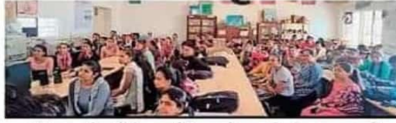
વનસ્પતિશાસ્ત્રનો અંગે નેશનલ વેબિનારનો લાભ લેતાં પાટણના છાત્રો.