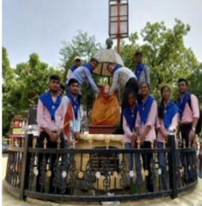
પ્રોગ્રામ ઓફિસર પ્રો. આર. ડી. વરસાતે કર્યું હતું.

This article is about cleaning and honouring the statues of different great personalities in Palanpur.