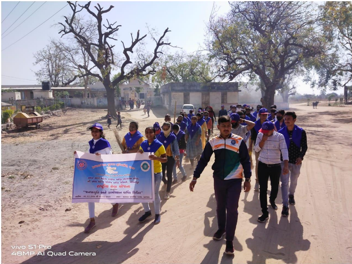
vivo S1 Pro 48MP AI Quad Camera