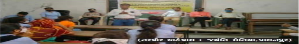
(તસ્વીર-અહેવાલ : જયંતિ મેતિયા, પાલનપુર)